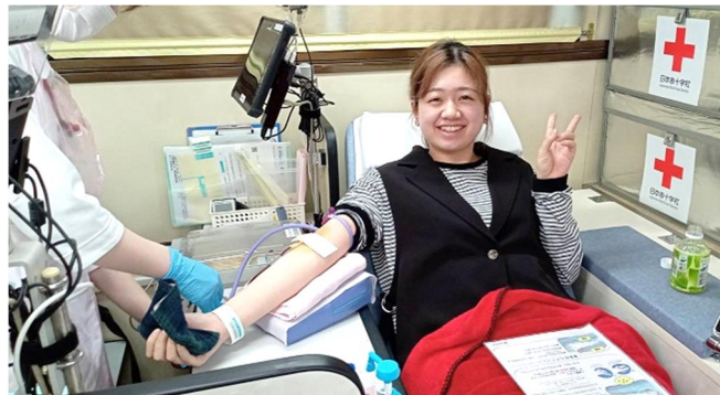
献血に協力する学生

本校では平成14年度にこの活動をスタートして以来、毎年継続的に行なっている。現在も新型コロナウイルス感染症の影響が残る中で、全国的に献血ボランティアへの協力者が大きく減少しており、全血液型が不足する中で、本校では今回協力を申し出た43名のうち条件を満たした36名が献血に協力した。