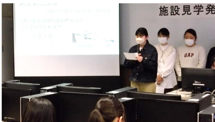
済生丸について発表する学生たち

発表を聞いた1年生からは、『済生丸の活動内容や設備だけではなく、利用者数についても知ることが出来た』、『検診の他に研修・見学や災害援助の活動も行って、人と人との繋がりをとても大事にしていると思った』などの感想が寄せられ、離島医療の体制について学びを深める有意義な時間となった。