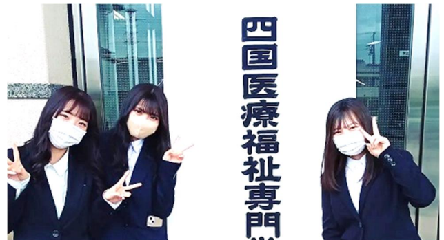
笑顔で記念写真を撮る学生たち(下)