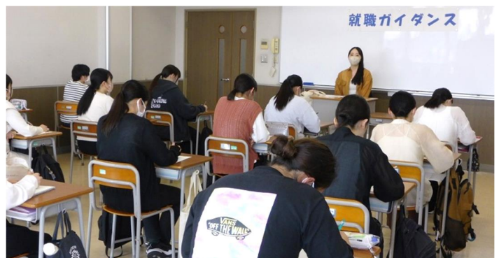
卒業生のアドバイスに耳を傾けた

ガイダンスでは卒業生が、業務内容について説明した後、学生からの質問に回答した。また、後輩へのメッセージとして、社会人としての心構えや学生時代にやっておくと良いこと、実習や就職に向けてのアドバイスも行った。学生たちはこれから就職活動に取り組むにあたり、卒業生からの貴重なアドバイスに熱心に耳を傾けていた。