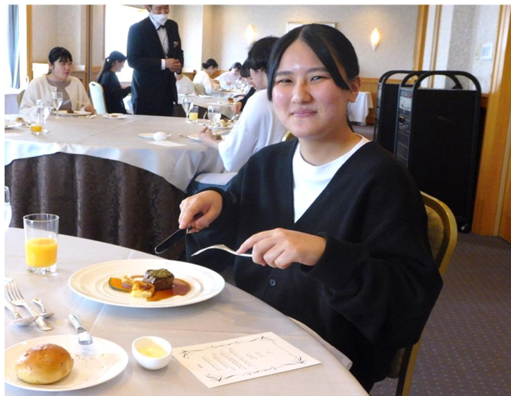
マナーに沿って料理を味わう学生

この講習は、社会人として正しい食事マナーを身につけることを目的として実施された。学生たちは予約の取り方や食事前のマナーを教わった後、フランス料理を味わいながら、基本的なナイフやフォークの扱い方、立ち居振る舞いなどの教養に触れ、講習を終えた。