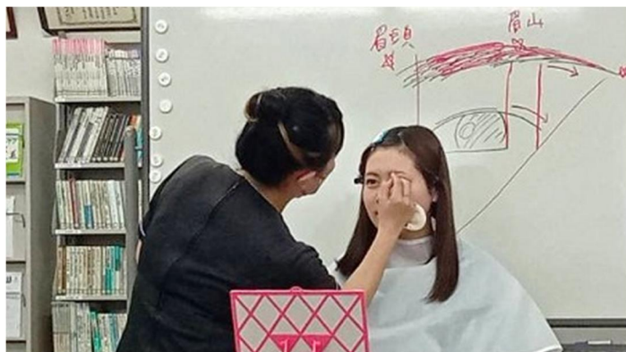
化粧品会社の方から実技を学ぶ様子

スキンケアでは、石鹸をしっかりと泡立てて洗顔することの大切さを教わり、実際に自分でやってみることでその重要性を実感した。また、病院の顔として働く医療事務スタッフとして、ふさわしいメイクの仕方を楽しみながら学んだ。