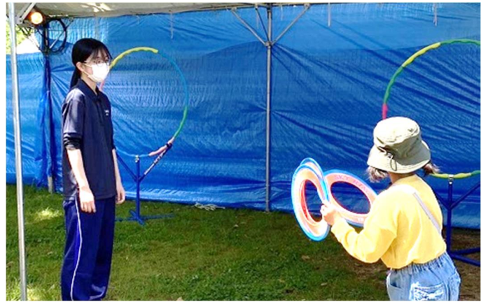
来場者にニュースポーツの楽しみ方を支援する学生たち

はじめのうちはどのように接したらよいか戸惑っていた学生たちも、次第にそれぞれが工夫し、小さな子供には目線を合わせ笑顔で声かけするなど、子供から大人まで多くの人に終始笑顔で接し、充実したボランティアが体験出来た。