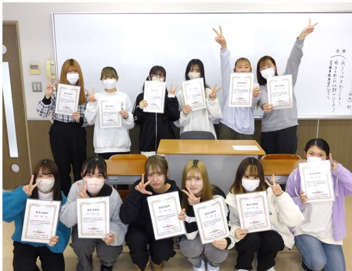
合格を喜び写真に納まる学生たち

2年生に進級後も、互いに切磋琢磨し検定や実習、就職活動に取り組むことが期待される。