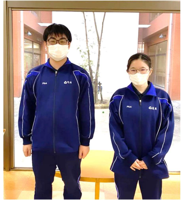
個々に応じた支援を学ぶ貴重な実習となった

6月下旬からはいよいよ最後の介護実習Ⅳに臨む学生たち。20日間の実習での更なる成長を楽しみにしたい。