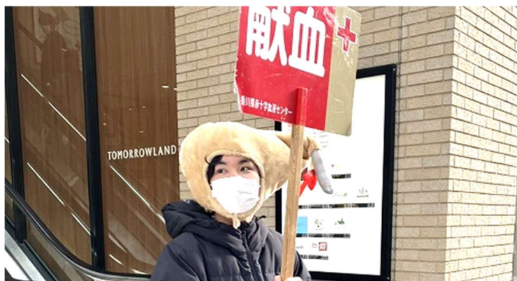
献血ボランティアを呼びかける学生

学生たちはクリスマスに合わせた衣装を身にまとい、商店街の買い物客や通行客に声掛けを行い、「献血に多くの人に関心を持ってもらい、足を運んでもらえるきっかけになって欲しい」との思いで大きな声で献血を呼びかけていた。