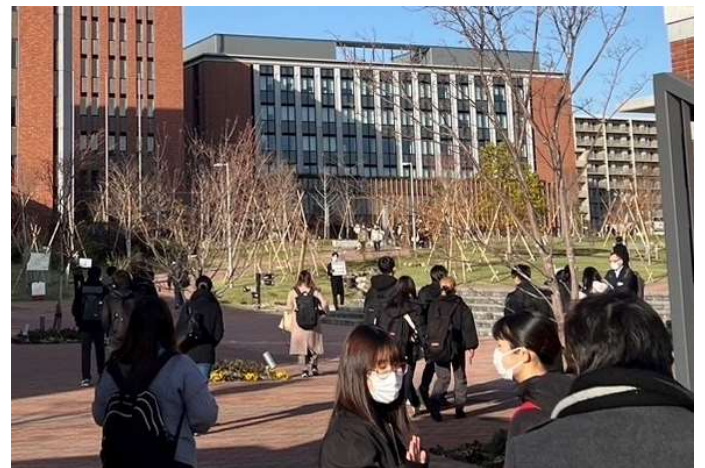
大和大学内の試験会場に向かう学生たち

3月3日（日）第37回臨床工学技士国家試験が大和大学（大阪府）などで実施され、3年生が受験した。