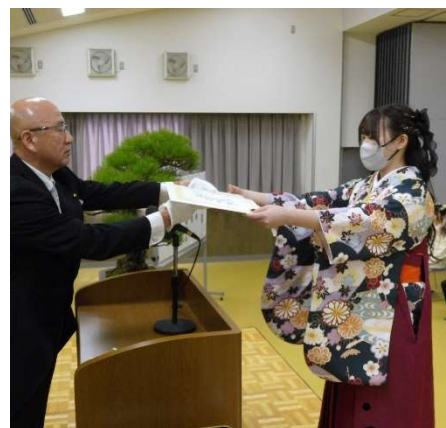
表彰を受ける卒業生