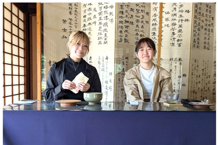
5月15日(水)1・2年生が高松市の代表的な観光スポットである栗林公園へ遠足に行きました！ 皆さんそれぞれ楽しい時間を過ごせましたね。