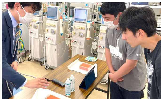
5月30日(木)医療機器メーカーの方による、超音波診断装置「エコー」を使った実践授業を行いました。