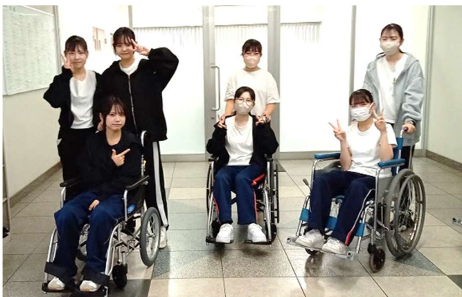
6月25日(火)介護福祉学科の先生による、車椅子を使った実技授業を行いました。