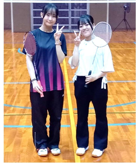
6月21日(金)高松市総合体育館にて、クラスマッチを開催しました。種目は学生の皆さんからの希望が多かったバドミントンで、楽しく身体を動かす良い機会となりました！