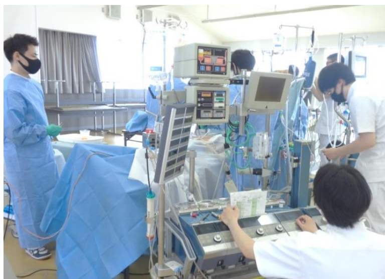
それぞれの医療職種に分かれて手術の流れを学ぶ学生たち

学生たちにとって実際の臨床現場で緊迫した手術室業務を経験する前に、学内で実践的な実習を行ったことは、有意義な時間となった。