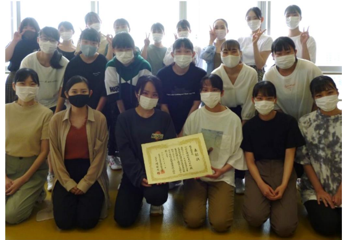
表彰状を手に写真に納まる学生たち

令和2年度に行われた、医療機関での受付業務や診療報酬請求事務業務についての能力を問う医療事務技能審査試験において、全国222校の団体受験校の中から、特に優秀な20校として見事に選ばれ、教育優秀校として3年連続7回目の表彰を受けた。