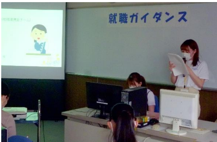
在校生に社会人としての心構えややりがいを伝える卒業生

ガイダンスでは業務内容、社会人としての心構え、仕事のやりがいに加えて、社会人1年目に新人職員として心掛けていたことなどの講話があった。最後に学生からの質問にも丁寧に回答していただき、貴重なガイダンスとなった。