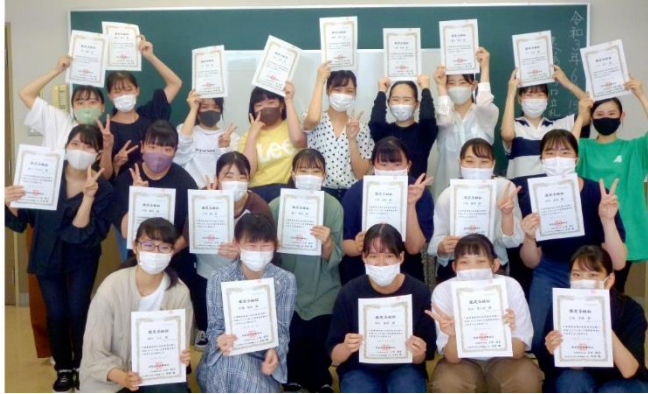
全員合格を喜ぶ学生たち

※この検定は福祉施設などで発生する介護保険請求に関する知識を問う検定試験である。