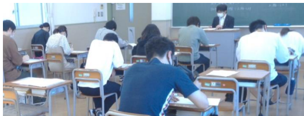
模擬試験に臨む学生たち

7月21日(水)第2種ME技術実力検定試験(9/12実施予定)※に向けて、3年生が模擬試験を受験した。今回の模擬試験は高知県、鹿児島県にある姉妹校と連携し、独自問題を作成して行われたもので、学生たちは約1ヶ月半後に迫った本番に向けて真剣な表情で試験に臨んだ。