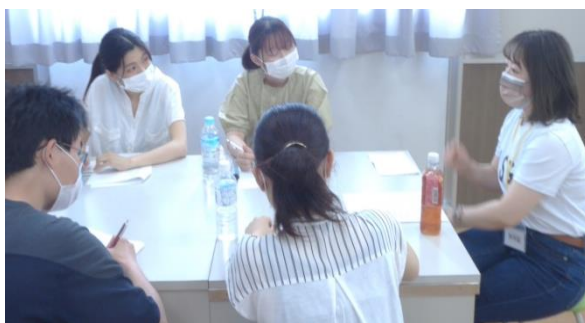
現場について意見を交わす在校生と卒業生