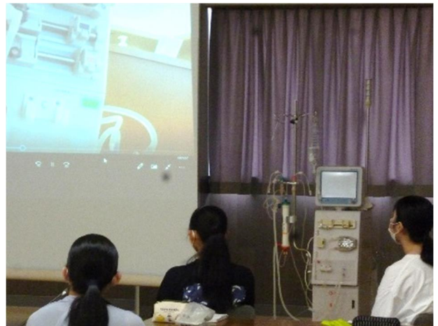
人工透析治療について説明を受ける学生

はじめに合併症の1つである糖尿病性腎症の人工透析治療について治療内容や目的、生活上の注意点、透析治療の動画を視聴し、その後透析治療に使用する人工透析装置やそれに付随する医療機器に触れ、理解を深めた。