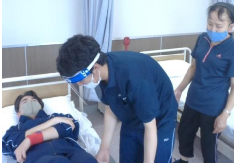
コロナ対策を徹底した中で実施(上) 福祉車両を用いた実習を行う学生(下)

次回の介護実習は、2年生にとって最終実習となり、8月23日(月)から20日間の予定で実施される。