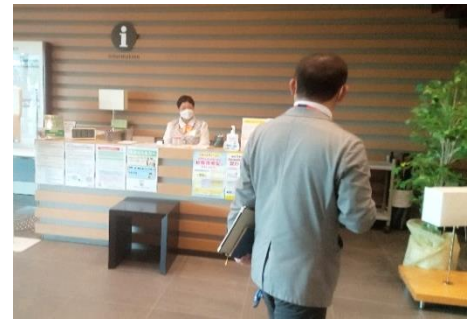
インフォメーションデスクのお仕事も見学。