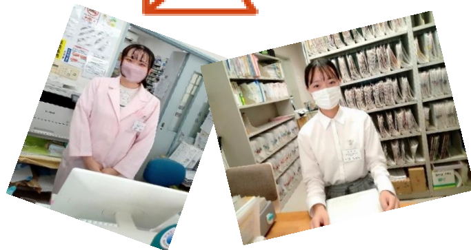
医療情報学科2年生、実務実習がんばりました！