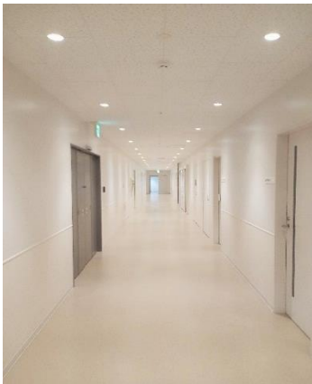
清潔で真っ白な廊下に見とれてしまいました。