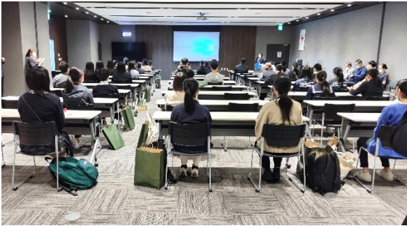
たくさんの方に参加いただきました！

参加者からは、「普段は見ることの出来ない、医療の現場を見られて興味深かったです」などの感想が聞かれました。