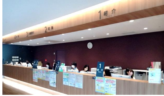
実際の受付に、みんなで座ってみました。