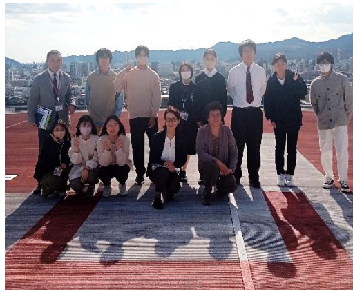
ヘリポートは、とても広くて眺めが最高！