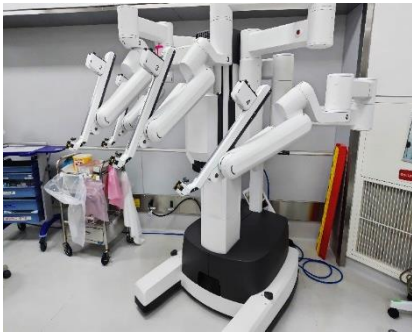
手術支援ロボット『ダヴィンチ』を実際に操作しました。